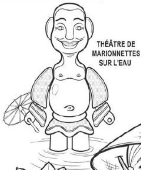
THÉÂTRE DE MARIONNETTES SUR L'EAU

Continent : Asie Pays : Viêt Nam Capitale : Hanoï