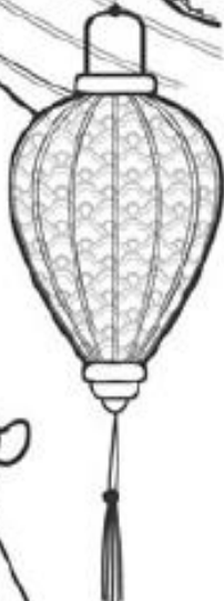
LAMPION DE LA FOIRE DE LA PLEINE LUNE A HOIAN